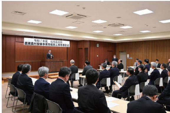
サンスイコンサルタント(株)