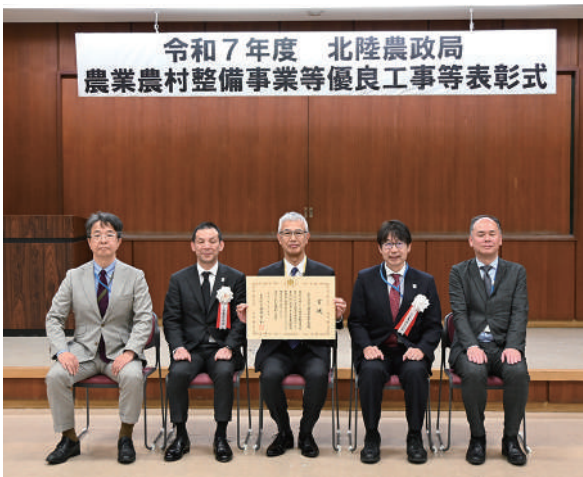
N T Cコンサルタント(株)